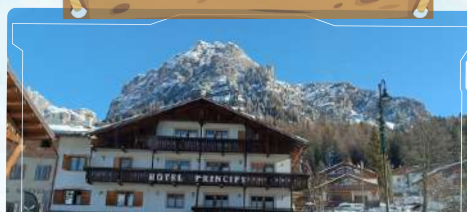
Hotel Principe delle Dolomiti